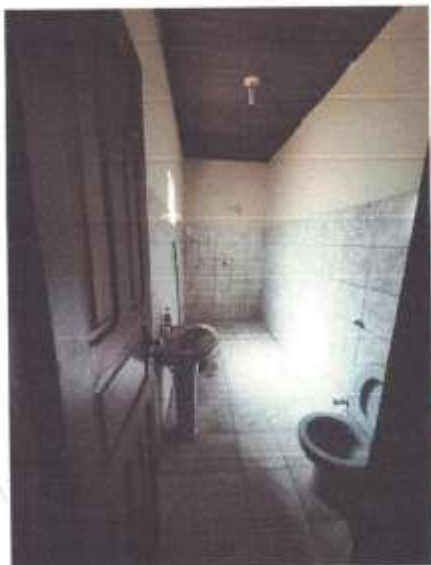
Imagem 13 – Banheiro 3