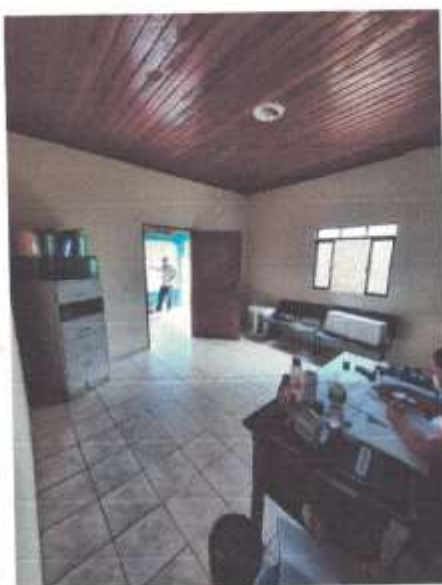
Imagem 4 – Recepção