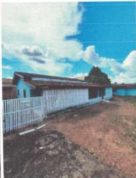
Imagem 2 – Fachada Lateral Direita