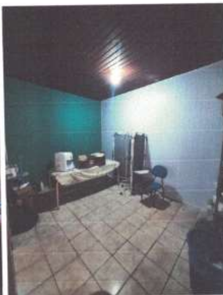
Imagem 5 – Sala 1