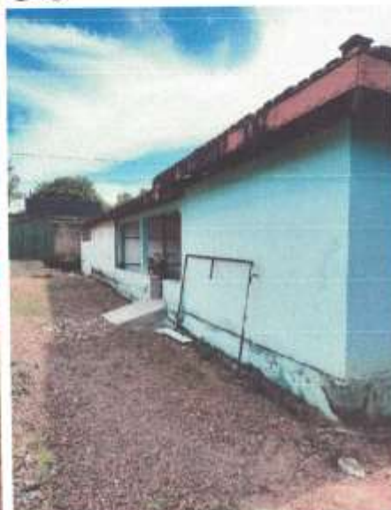
Imagem 3 - Fachada Lateral Direita