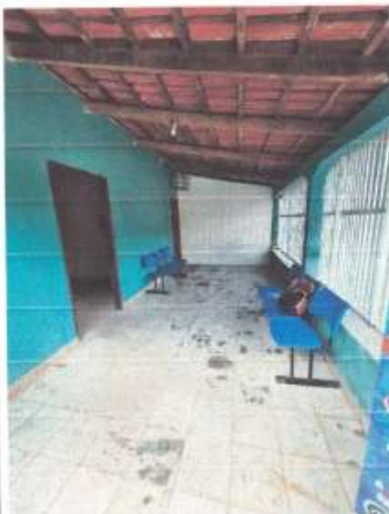
Imagem 14 – Varanda 1