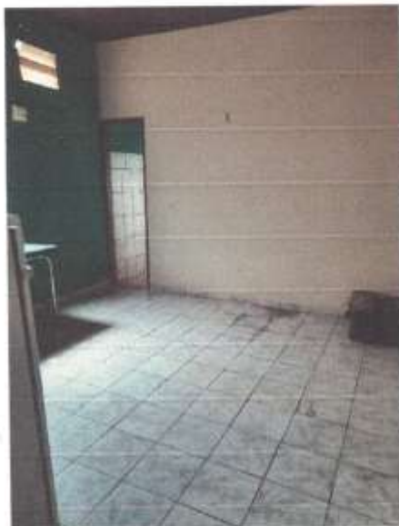
Imagem 7 – Sala 3