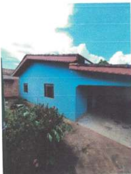
Imagem 1 – Fachada Frontal