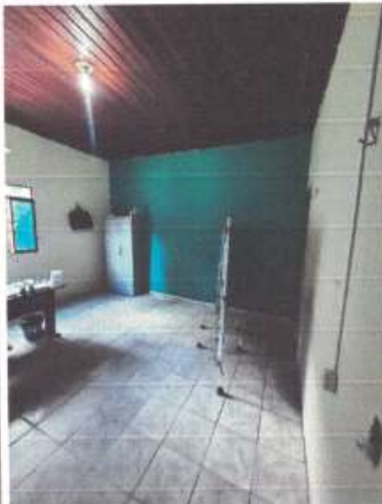
Imagem 8 – Sala 4