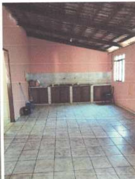
Imagem 9 – Cozinha