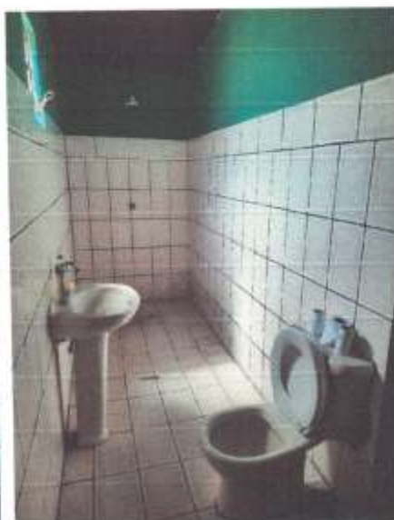
Imagem 11 – Banheiro 1