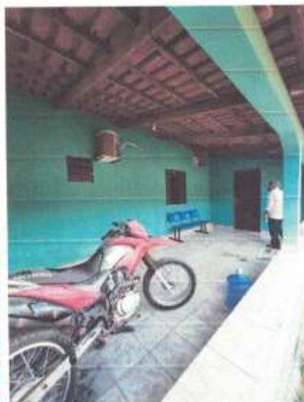
Imagem 15 – Varanda 2

São Félix do Xingu – PA, 17 de março de 2021