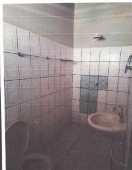
Imagem 12 – Banheiro 2

Joel Bento Ribeiro Engenheiro Civil CREA 24816/D-GO