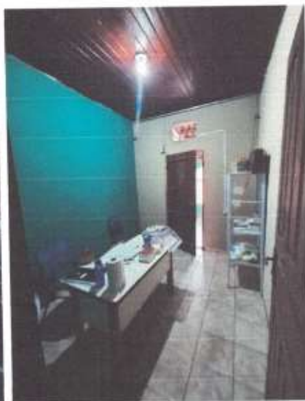
Imagem 6 – Sala 2