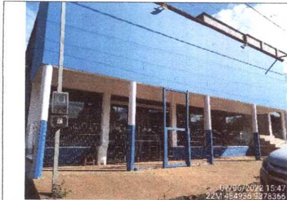
Figura 1 – Imagem da fachada frontal do Imóvel. Edificação em alvenaria cerâmica, coberta com telha cerâmica, rebocada e pintada, caracteriza um padrão médio de acabamento