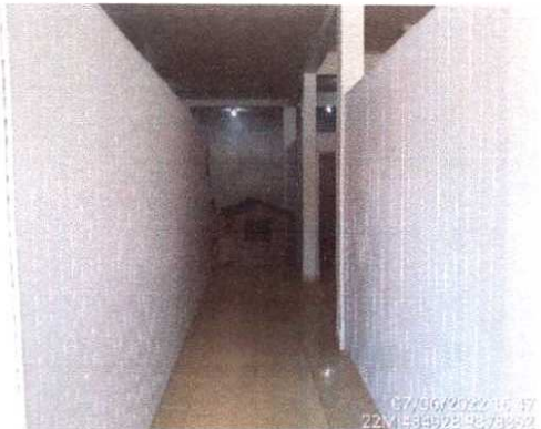
Figura 3 – Vista interna. Corredor de entrada do imóvel.