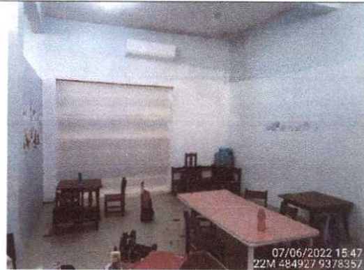
Figura 4 - Vista Interna. Em destaque a sala de aula. Estado de conservação e manutenção do edifício em geral é bom e adequado onde foi realizado uma reforma para fazer divisórias.