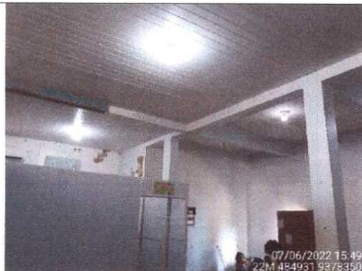
Figura 5 – Vista interna. Em destaque é a sala de aula. Apresenta uma conservação boa e adequada.

Helson Fontes Ribeiro Engenheiro Civil da PMSEX – PA. CREA/PA nº 151953248-2