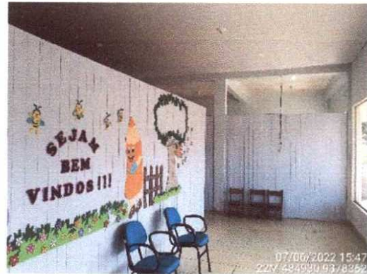
Figura 2 - Imagem da fachada frontal interna. Mas aceitável para locação.